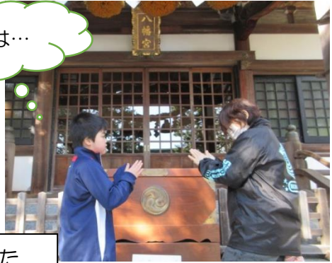
初詣 お参りの仕方もし習いました。